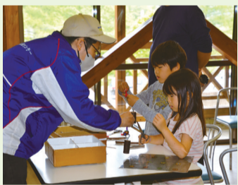
▲バードコールづくり体験