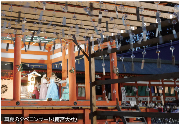
真夏のタバココンサート(南宮大社)

岐阜県の南西部に位置している垂井町は、豊かな自然を紡ぐ伊吹山に抱かれ四季折々の表情を楽しめる場所がたくさんあります。このような垂井町でのんびりと心穏むひと時をお過ごしください。