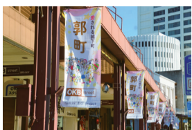
「ストリートフラッグ」 大垣郭町商店街のアーケード（OKBストリート）に約70枚掲出されています