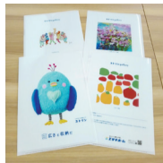
「ユトリンギャラリー」 エサキホームの店舗やイベント、販売物件を見学されるお客さまなどにプレゼントされます