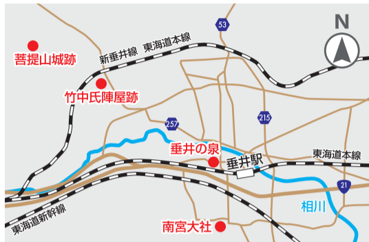
・菩提山ハイキングコースについては、垂井町観光協会のホームページをご覧ください

豊かな自然や伝統文化が息づく“清流の国ぎふ”。観光名所や伝統ある祭り、特産品など魅力が盛りだくさんです。このコーナーでは、そんな岐阜県の魅力を観光担当者の皆さまに紹介していただきます。今回は岐阜県垂井町です!