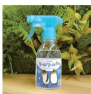
「クールワーカーポケット」 シャツや靴下など、直接肌に触れる衣類に吹きかけ、染み込ませることで清涼・冷感作用をもたらします

3月8日（水）、トモニアートプロジェクトの発足一周年を記念した交流会を開催し、サポーターなど19団体、34名に参加いただきました。