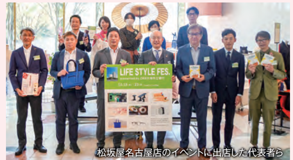
松坂屋名古屋店のイベントに出店した代表者ら