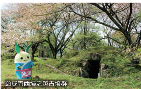
願成寺西墳之越古墳群

池田町には歴史的史跡もあり、代表的な史跡として願成寺西墳之越古墳群があります。面積約9ヘクタールに114基もの古墳が集まっている群集墳で、岐阜県でも最大級の規模です。昭和44年には岐阜県の史跡に指定されました。古墳群の中で最も古いものは5世紀後半のものになり、1500年以上の歴史を誇ります。池田山の麓にありますので、自然の中で歴史探求を行うのも、また味違った楽しみ方ができるかもしれません。