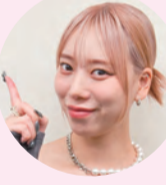
タナカガ 1999年2月12日生まれ。大阪府出身。

昔からCMソングでなじみのあるOKBのアリアンバサダー就任…。やっと実感がわいてきました。ほんとにほんとに嬉しいです。この地域を盛り上げられるように頑張ります!