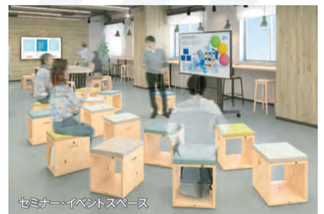
セミナー・イベントスペース