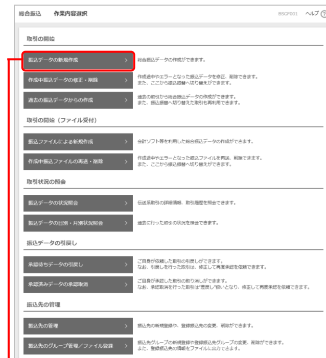
振込データの新規作成

作業内容選択画面が表示されますので、「振込データの 新規作成」ボタンをクリックしてください。