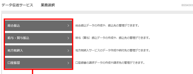
総合振込、給与・賞与振込、地方税納入、口座振替

「データ伝送サービス」メニューをクリックしてください。続いて業務選択画面が表示されますので、「総合振込」「給与・賞与振込」「地方税納入」「口座振替」のいずれかのボタンをクリックしてください。