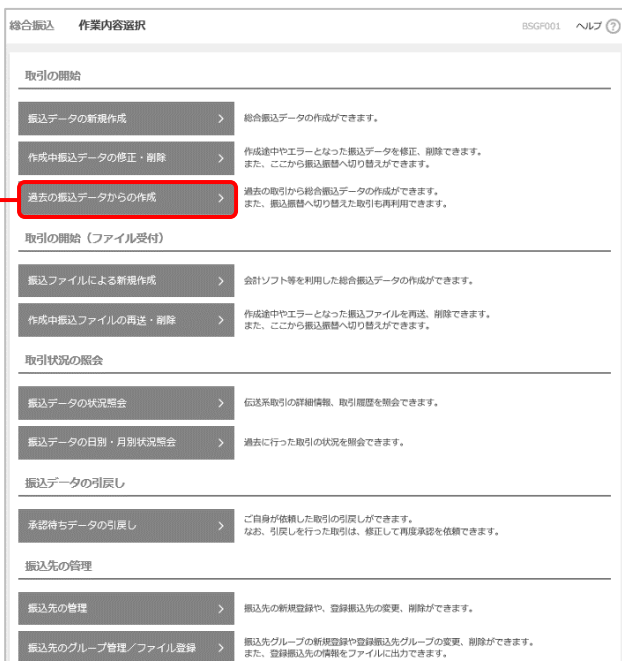
過去の振込（納付・請求）データからの作成

作業内容選択画面が表示されますので、「過去の振込（納付・請求）データからの作成」ボタンをクリックしてください。