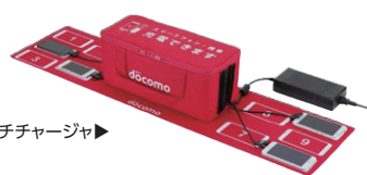
マルチチャージャ▶