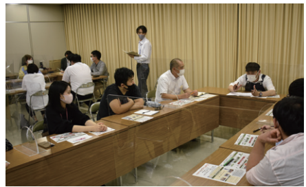
▲ワークショップの様子

岐阜県養老町から「新商品開発共創プロジェクト」の企画・運営業務を受託し、「新商品共創ワークショップ」を開催しています。外部から講師を招き、ワークショップを通じて町内事業者、町民、町内在勤者とともに、「養老町の新たな特産ブランド開発」を目指しています。