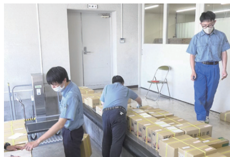
▲社員が活躍している様子

なおOKBはこれまでも、障がいのある職員専用の事業所「OKB工房」の開設や岐阜県内すべての特別支援学校23校と自立支援などに関する連携協定を締結しています。