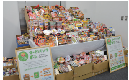
▲締結式で贈呈した食品