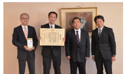
▲表彰状受贈式の様子

OKBグループは1970年代から献血推進活動に取り組んでおり、本店ビルでのOKBグループ役職員による献血協力や、岐阜県・愛知県の赤十字血液センターと協力して、献血センターや献血バスでの協力の呼びかけ・受付・誘導などを継続的に実施しています。これまでのOKBグループの献血推進活動が評価され、「厚生労働大臣表彰」を受賞しました。