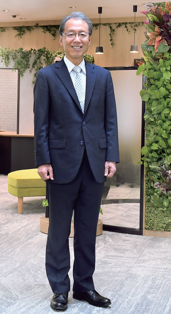
OKB大垣共立銀行 ニュータウン支店